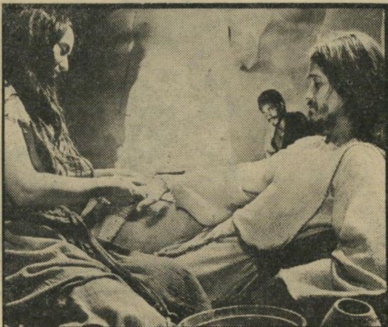
ניילי ואלייאן: חיבורים וחלושים