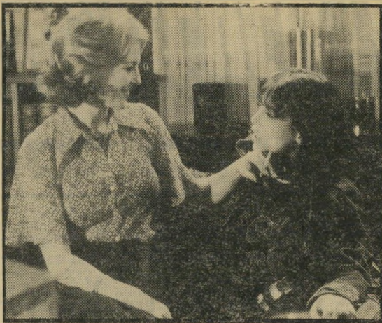
אד'אני וקורסל: אין הבנה במישפחה

ביותר, וכמה פעמים במשך הסרט נדמה כאילו הגיעה לקיצה, הרי טיבעיותם של ונטורה ואד'אני, הדיאלוגים הפשוטים והאמינים, והימנעות מכוונת מזהר מוגזם, הופ-כים את הסרט לביקור חטוף וחביב בחיקה של מישפחה צרפתית. ורק חבל שאין בישראל בעיות כאלו שיש להם שם.