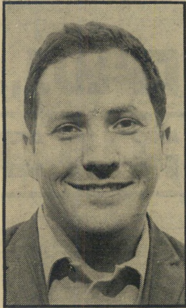
עורך זיק של אמונים

השניים גופו בו על כי תוכניותו השבור עית במוצאי-שבת, הפכה תוכניתם הפר