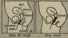
הכניסה לא נכונה לא נשעק עמדת

טמפון o.b. תוכנן ופותח ע"י צוות גיניקולוגים מומחים, כך שיכנס עמוק לתוך הנרתיק לאיזור בו אין עצבים רגישים הגורמים לכאב, או אי נוחות.