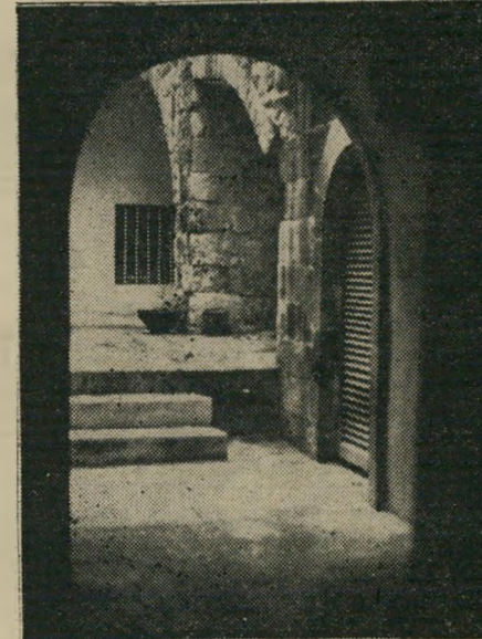
בית משוחזר בעיר העתיקה מי ומי על חשבון ?

חורבות ללא סובסידיות. המיקרים שאותם יבדוק הצוות במיוחד הם של ה- סקידים שקיבלו דירות אשר שופצו על חשבון החברה הבונה והמשקמת את ה- רובע. סקידים אלה שילמו 35 אלף לירות תמורת הדירה, שזכתה לשיפוץ מלא בכספי המדינה. את גודל ההטבה ממחישה העובדה