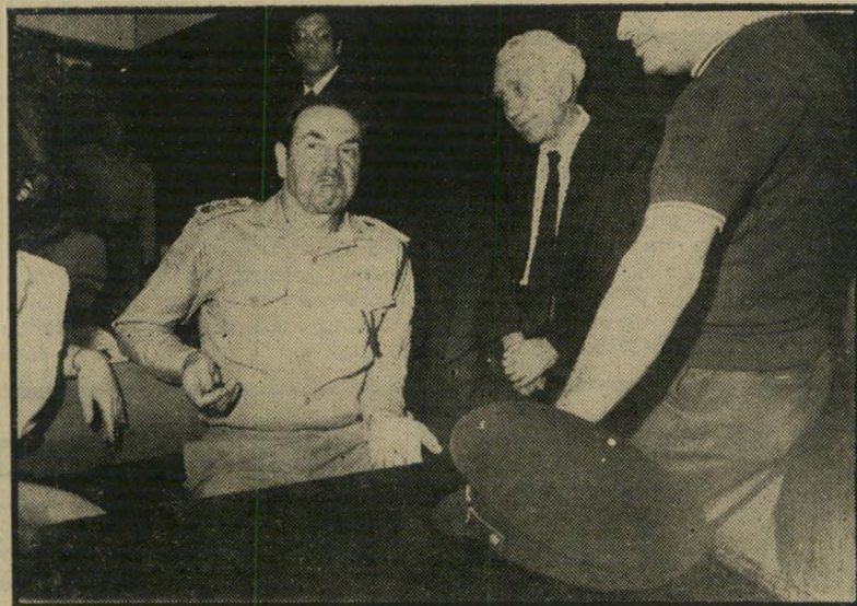
ניצבי-מישנה זינג בבית-המושפט הגבלת החקירה

על עבירות-שוחד ניתן לתבוע רק אזרחים ישראליים, ורק אם העבירה נעשתה בישראל, אם