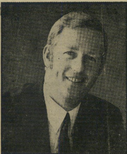
נציג הגרמנים ראהה הצנתת הפרשה