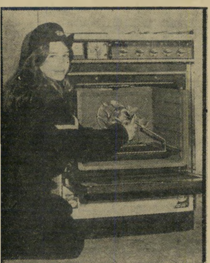
„שוטרת“ במודעה לתנור התחזות כאחר

כך, למשל, מופיעה במדור „שיחזור פשע“ כתבה על הרצח הראשון באשדוד, שלטענת מערכת חדשות המישטרה אירע באפריל 1965. הכתבה והתמונות המופיעות בה, הם העתק מדוייק של כתבת העולם הזה שראתה אור באפריל 1963