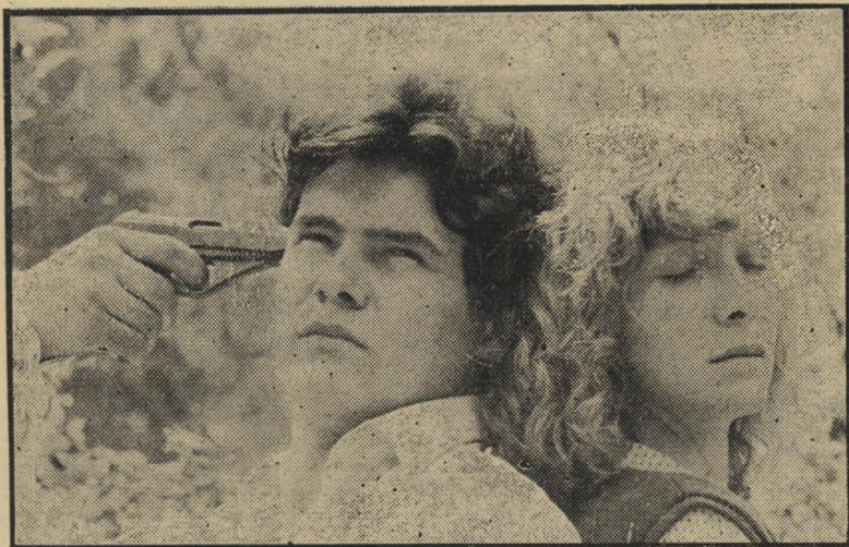
בנז וקלמן: משתתפי-הפעולה והיהודיה המתמררת גם קדושים וגם מיפולצות

כיום צרפתים. וכאילו על-מנת להר- גיש את הסאה, מציג מאל את כל המישרה הגרמנית בעיירה, כשאין בה אפילו גרמני אחד לרפואה, כולם צרפתים, שהצטרפו ל- גסטאפו בגלל ריגשי-גחיתות, משום שנית נה להם ההזדמנות לנקום עוולות אמיתיות או מדומות, או סתם מפני שכך יותר נוה,