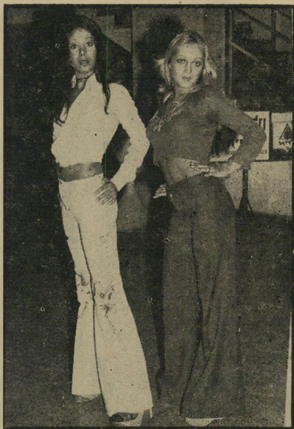
רושקה ושיבה אהבת היורה

האם תצליח הנכדה הסרייה להמיט את לב הסבא המחרים?