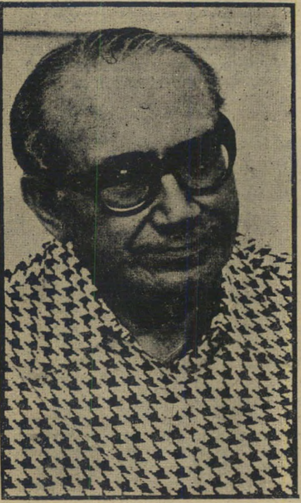
נגיד ויזו דורש חקירה

א וניברסיטת תל-אביב מרוכות סביב שלוש משרות שהן מוקדי הי-