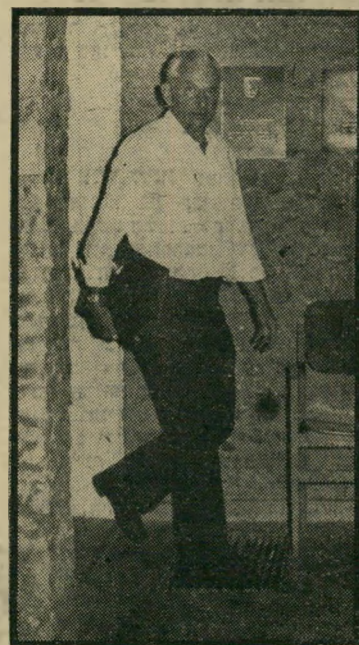
השר ברילב אזון קשבת

"הוא השתגע", לחשו עובדי מישרד המיסחריותתעשייה, כשהם מתכוונים לבוס שלהם, השר חיים ברילב. היה זה לפני כחודשיים, כאשר ברילב גילה לעובדי מישרד שהוא עומד לערוך מיבצע הולת מחירים כלל-ארצי. אך מאז עברו חודשיים, והתברר שברילב בכלל לא השתגע. בתחילת המיבצע פנה ברילב אישית לראשי התאחדות התעשיינים, ראשי חברת-העובדים ולמשווקים הגדולים. הוא הציע להם להוריד מעט את מתח-הרווחים, הבטיח שהדבר ישתלם להם. תחילה נתקל בהיסוסים. אך הוא המשיך ללחוץ.