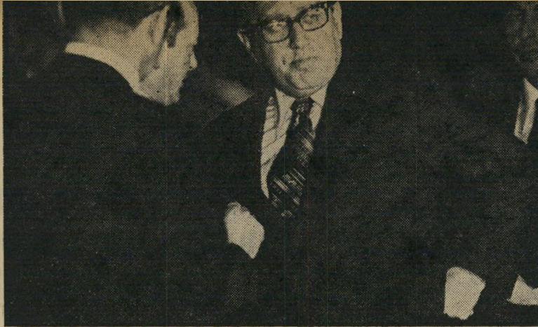
קיסנינג'ר עם יגאל אלון דמעות בעיניים

השאלה היא: האם יתאמת חשבון זה גם הפעם? הנסיבות השתנו במידה רבה. יש גורמים רבים, העשויים לשנות את מרכיבי החשבון מעיקרם, ובין השאר: