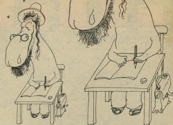
ממלכתנו המודרנית סוס - ממלכתנו-דת המודרנית שניים