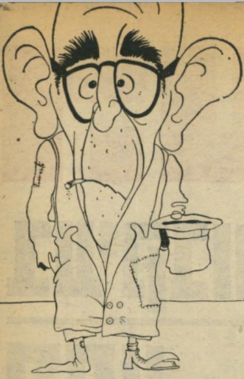
המדינה זה עני