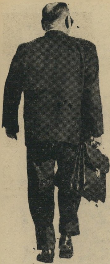
איסר הראל מאחרי הגב

דיין, לבון, עם כולם. בן-גוריון קיבל אותו יפה, אבל לא היה מוכן לגלות כלום. ככה נהגו גם האחרים.