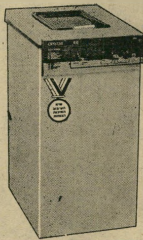
מכונת כביסה "לידי"