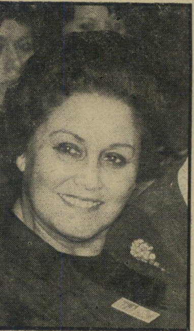
ח"כ משיורדה גז עכבר בין יונה ונץ

ישיבת סיעת המערך שנערכה בשבוע שעבר בכנסת, ודנה בהקמת יישוב תעשייתי במעלה האדומים היתה אחת הישיבות הסוערות ביותר שנערכו אירעם בי בית ריב קולוני בין ניצים ליונים, בין