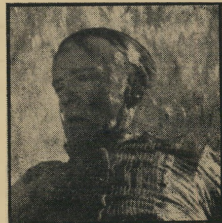
חזיפן: פרד אסטר השיטפון הסופי -- האשליות פורחות

הבמאי המיועד לסרט היה ג'ון גילרמין, בעל-מיקצוע שאישיותו אינה ברורה די הצורך, צרפתי חניך בריטניה שביים סר