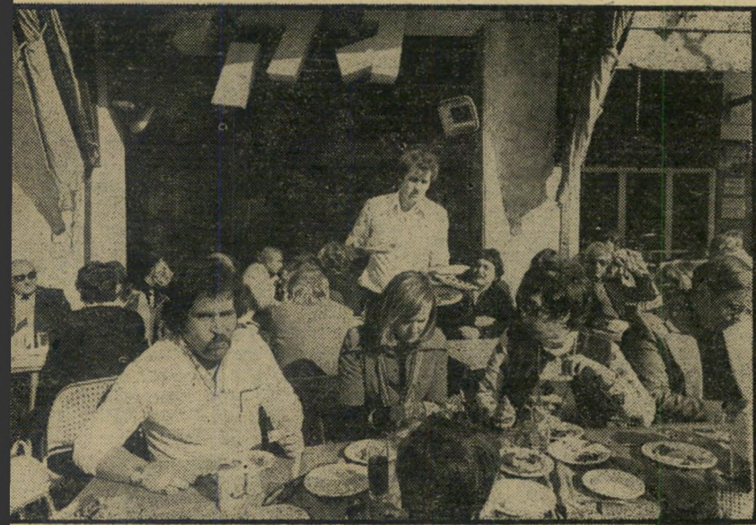
המרכז החברתי הסואן. מנהלים, עיתונאים ושחקנים מסיימים את ישיבות יום ג' בשעה מוקדמת מן הרגיל, כדי להספיק לשבת בג'קי. במקום זה נערכים מיפגשים קב