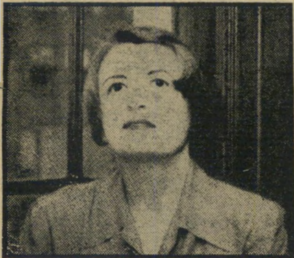
סופרת איין ראנד הנפילים מורדים באוסטרליה

קרוי פחד. ערב צאתו ביטא את פחדו זה בצורה קיצונית, לא רק כאמתלה לירידתו מן הארץ, אלא