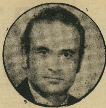
מנכ"ל לוי עצימת עין

אילו פנה בנק טפחות בשאלה מדוע לא הגיע התשלום, היתה התשובה באה מכץ, כממנה על התשלומים, הוא היה מרגיע את טפחות, מספר כי הכל יסודר תוך כמה ימים. אבל האמת המרה היא כי לאיש במוסדות