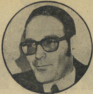
יו"ר אלדורטי הלוואה לרכב

ב חודש נובמבר 1974 פירסם מנכ"ל חברת עמידר בעיתון החברה קול"ק קורא לעובדיה, שעיקרו הצורך בהידוק הביקורת הפנימית על כספי החברה. קול"ק קורא זה, הגראה כיום כלעגלרש, כלל גם את הקביעה כי הביקורת הפנימית צריכה להימנע מצבים שעליהם נאמר בארמית "לא עכברא גנב אלא חורא גנב", וב"עברית צחה: "לא העכבר גנב אלא ה"חור", או — הפירצה קוראת לגנב.