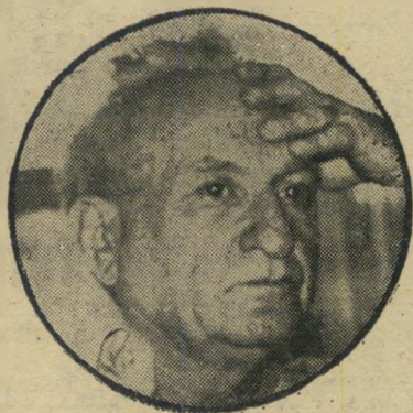
ח"כ קרגמן פיתרון החשבון

הקונים הם גם בעלי-חגלריה "קינג דיוויד" שברחוב פרישמן בתל-אביב.