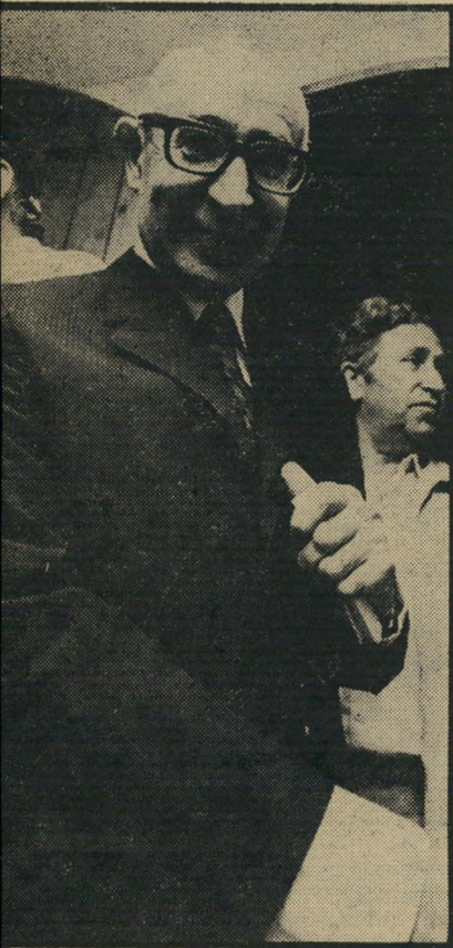
שריחאוצר רבינוביץ מכה על הראש

אילו לקחו פטיש והלמו על ראשו של האזרח הישראלי, לא היתה המכה מהממת יותר מזו שירדה עליו השבוע, עם הגשת תקציב-הממשלה. האזרח כבר נאבק על קיומו הכלכלי כפי שלא נאבק מעולם. הרוח הרעה של האבטלה מהלכת עליו אימים. והמכבד נאלץ לוותר על דברים שהיו עד כה מובנים מאליהם לקיומו. "הידוק החגורה"