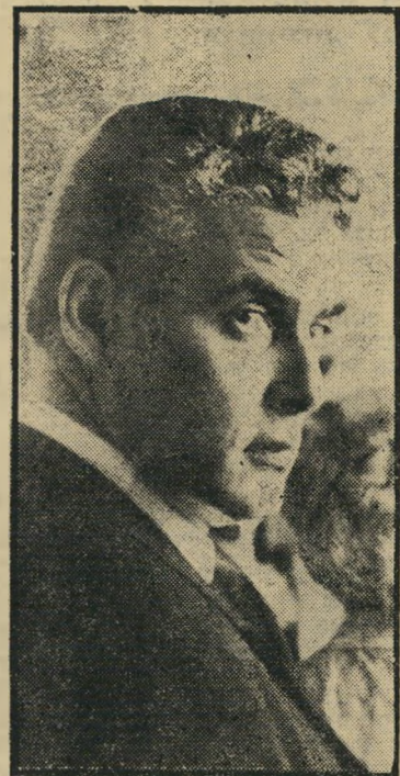
מנכ"ל "רסקו" קרוא ז'ל

חכמים במועצת-המנהלים של "רסקו". אבל כשנותנים לעסקנים קטנים לנהל חברה ממשלתית בי חוקת כזה — אין לחתמלא על הדי תוצאות.