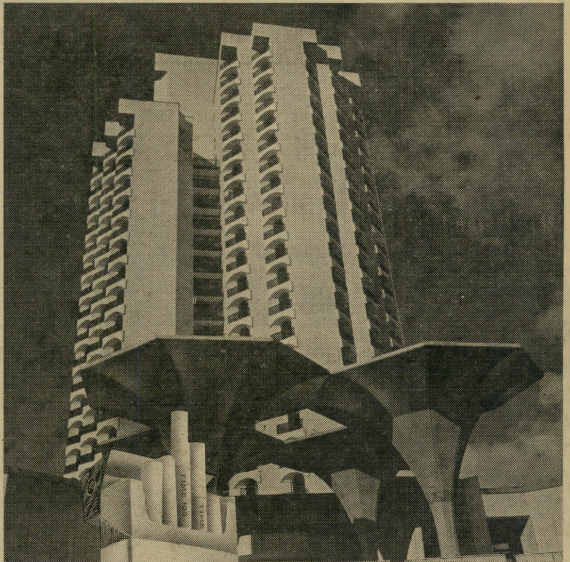
חלון הלטון החדש בירושלים

סוכר קינגסייז כילטר הארוכה והעדינה אחת היצירות המעולות של דובק