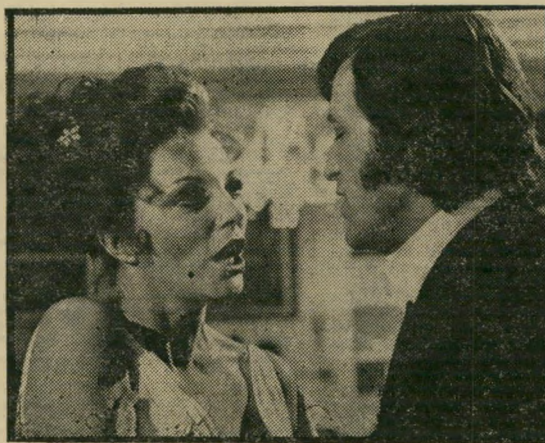
ג'ואן קולינס — אובייקט להערצה

ההמשך, הכרוך בכמה דילוגים נוספים מעולם לעולם (מבקר תיאטרון הופך סופר מדע, מדען מתקדם הופך מדען קפוא), והאהבה מגשרת לבסוף בין שני העולמות.