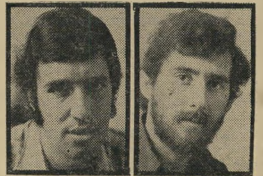
רייס בינקין תנו לעבוד בארץ הזאת!

דוגמה זו היא רק אחת מרבות שמנהיגים שני הצעירים בחברה שהקימו, ואשר זכתה להצלחה כה מסחררת עד שהחלה מנקרת