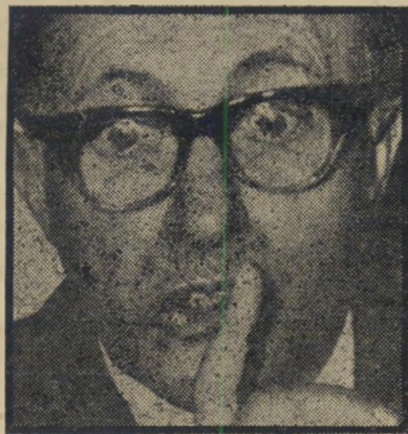
בנין מה מצחיק כאן?

...מר בנין השתמש במשך שנות חייו בכמה וכמה פס'ידונים כמו יונה קניגס