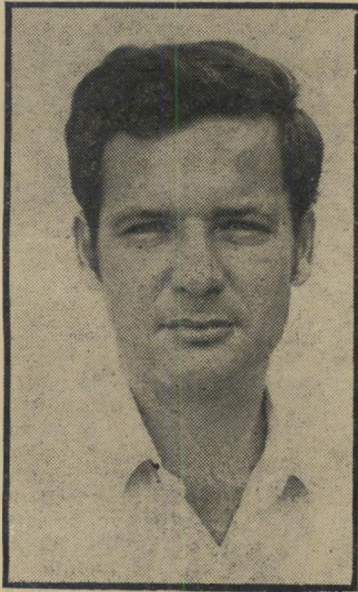
דובר דרוקר מילחמה עדי-חרמה

חיוך של ניצחון נח לאחרונה דרך-קבע על פניו של שריהחקלאות, אהרון ארון. ואין פלא בכך. הוא יודע שהוא עשה את זה. מאמציו הוכתרו בהצלחה, לאחר שישה חודשי מאבק — והאורה יצא נשכר. לפני כשישה חודשים יצא אהרון ארון במיבצע הוולת-מחירים של התוצרת ה-חקלאית, כשמטרתו הכפולה המוצהרת: לסייע לאורח לחסוך בהוצאות-הצריכה שלו ולאזן את תקציבו, ולהקטין את מתח הרווחים — המופרז, לדעתו של השר — של המתווכים בין החקלאי לבין הצרכן. כאשר הצהיר השר כי בכונתו להויל את המחירים, כימעט שלא התייחס איש ברצינות רבה מדוי להודעתו. שכן, תח-זיותו לגבי תוצאות המיבצע ניראו ודוי דות מדי. אך כיום יכול ארון לחייך בי-סיפוק. המיבצע הוכתר בהצלחה. מילחמה גלויה במאפיה. לגיבוי הצהרתו לפני חצי-שנה, אמר ארון כי ניתן בהחלט להילחם באנשי המאפיה השולטים בשוקי-השיווק של התוצרת החקלאית, ול-