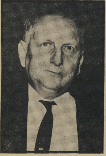
נגיד-לשעבר הורוביץ רישיון מוקפא