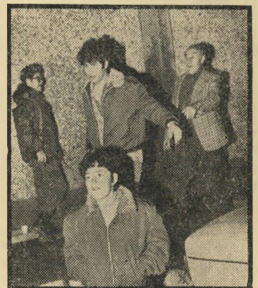
גירוש מהוועידה מכות בחמת-זעם

כמו-כן חבל, שלא דיווח הכתב אר-זות המכות שהוכינו בחמת-זעם על-ידי אנשי חרות. סימני המכות עדיין ניכרים בנו, שבוע אחרי המיקרה. אכן, גם בדיבורים, גם במחשבה וגם בהתייחסות לאנשים פוליטיים מקבר צות אחרות לא השתנו תלמידיו ז'ברי טינסקי. היתה זו התנהגות ברוטאלית — הפאשיזם בהתגלמותו היהודית — בעירו של אברהם אבינו, ארץ-ישראל השלמה.