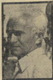
ממונה חן לא אשם

קראתי בתמיהה רבה את הסיפור על עצמי (העולם הזה 1949). שלפיו כבר יצאתי לפנסיה אלא שביקשתי לא לפרוש, לפי-שה, את העובדה שמיכאל דק "ירש" אותי, עד שאסיים את ה"משא-ומתן על גובה הגימלאות שלי. המשא-ומתן בעניין זה נמשך כבר, לפי המספר בגילוי המרעיש, זמן רב, ובינתיים מתקשה מיכאל דק לפעול. מאחר שבכלל עוד אינני יוצא לפנ-סיה, ואף מקווה שהשלום יקדים את פרישתי; והיות שאני ממשיך ב"עבודתי במשרד העבודה ובין ה"שאר ארכו את ענייני ההסברה של שירות-התע"סוקה; ומאחר ש"ירשי" מיכאל דק, כלל לא מת-קשה לפעול — ולפחות אינני מפריע לו — לא הייתי מטריח את עצמי למרוט את נוצותיו של ה"ברווז" הזה, אילולא מישפט אחד שאני רואה בו עלבון שאיננו מגיע לי והוא, שאני "מנהל זמן רב משא-ומתן על גובה הגימלאות" שלי.