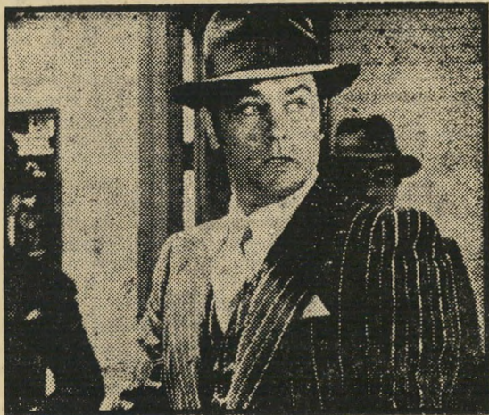
דילון: בורדלים משנות השלושים

הפרק השני, לעומת זאת, מצטיין בכך שבלמונדו נעלם. הוא מת בסוף הפרק הראשון, כניראה מפני שדרש שר גבוה מכדי שישבו ויעלו אותו מן הקבר. דלון נותר לבדו, עם תפאורות נאות של בורדלים משנות השלושים, מכר נית של התקופה, ועם הרבה מאוד מכוונות-ירייה, לחן נכתבו שורות הדיאלוג העיקריות בסרט. אומנם יש כמה תוספות המשונות בתסריט השני, להבדיל מן הראשון. שחרסמים במארסי, פוליטיקאים מכורים לעולס-התחתון, שחיתות במישטרה וכן חלאה, אלא שזה מוצג בצורה מושגמת מאוד, כתיזכורת המבק שת להוכיח כי עושי הסרט, "ערים לרוח הזמן", ולא כחלק בלתי-נפרד מן הסיפור עצמו.