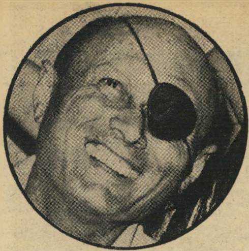
משה דייגן משבר בתוך המיפלגה