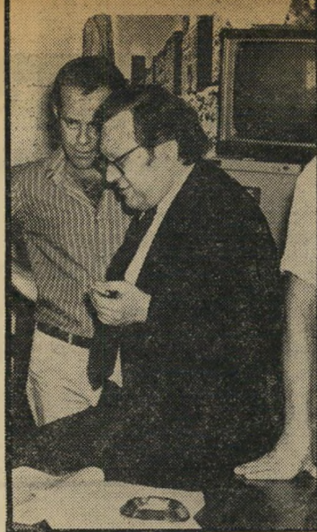
דובר אבנר הפעם זה הוא

אבנר, אינה שלו. אולי תתקנו את הטעות? רם נוי, ירושלים