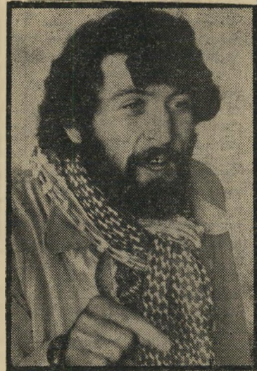
סטודנט מחוץ פעילות - אפס

דש חלק גדול מהזמן לשאלות שעוררו הסטודנטים הערביים בבעיות שונות, ובכלל זה פיסורי מורים בשל התערבות הש.ב. השאלות הקראו עליידי, ואף נתתי זכות שאלה בעל-פה למיספר סטודנטים ערביים באותו הקשר. לשאלות אלה (בשל האקטואליה) הצמדתי שתי שאלות שהופ- נו אלי בכתב עליידי סטודנטים יהודיים שנוכחו במקום, ששאלו האם יש מקום באוניברסיטה יהודית לסטודנטים ערביים הנהנים מסיבסוד לימודיהם עליידי ממי- שלת ישראל וממביעים תמיכה באש"ף. סוגייה זו, של הש.ב. ואש"ף, גולה