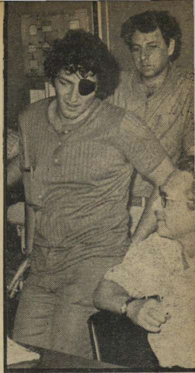
סרן ניר וירדו מבט לצה"ל

אך מסתבר כי התרגשותם של אנשי רשות השידור היתה לא-במקומה. מרבית המאזינים, חובבי הספורט, מעדיפים לשמוע סקירה מועדבת על מה שקורה בכל המיגרשים עלייני שידור מישק"ה. רובם ממלאים טפסי טוטו, והגל הקל מעיניק להאזנתם את מימד המתח שבהימור. באותו זמן בו משדרים שני הגלים כדור רגל, משדר גם א' מוסיקה קלאסית, שלה האזנה בדרך כלל מועטה. מליאת רשות השידור ביקשה מהתחנה הצבאית לוותר על שידור המישק, ולשדר תוכנית מת אימה לחוג נרחב של המאזינים, הנשים שאינן מתעניינות בספורט, ומוסיקה קלה. אך בשבוע שעבר נתנה גלי צה"ל את התשובה השלילית הסיפית שלה. מאבק יוקרתי חשוב, כנראה, יותר מאשר שירות למאזינים, המממנים מכספם גם את התחנה הצבאית.