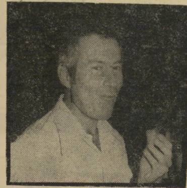
מפקד נאור מאבק-יוקרה

הדוגמה הקלאסית לכך היא עניין שיי דור מישק"הכדורסל עליידי גלי צה"ל מדי-שבת אחרי-צהריים: כשהתחילו בר גלי צה"ל לשדר בשידור חי מישק"ה כדורסל מדי-שבת, קמה צעקה גדולה מצד