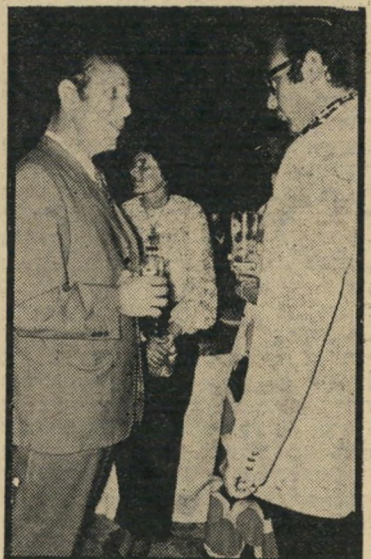
דובר אבנר משכורת למה?

כך קורה שבעלי המדורים העוסקים ברדיו או טלוויזיה או המבקרים, מקבלים מרשות השידור את ההדפס עם רשימת ה-תוכניות לשבוע הבא, כאשר לעיתים מופיר