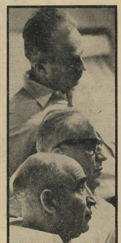
רבין, משל רבינוביץ

ביטחון אישיות שניהל פרס עם רבין ועם שרים אחרים בממשלה, הוא ניסה להעמידם על חומרת המצב ולגייס את תמיכתם להגדלת תקציבו. אלא שמול תביעותיו של פרס ניצב כחומה איתנה שר האוצר יהושע רבינוביץ.