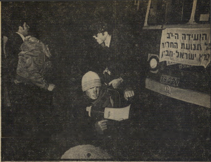
מחסום בדרך: מפגין לפני האוטובוס