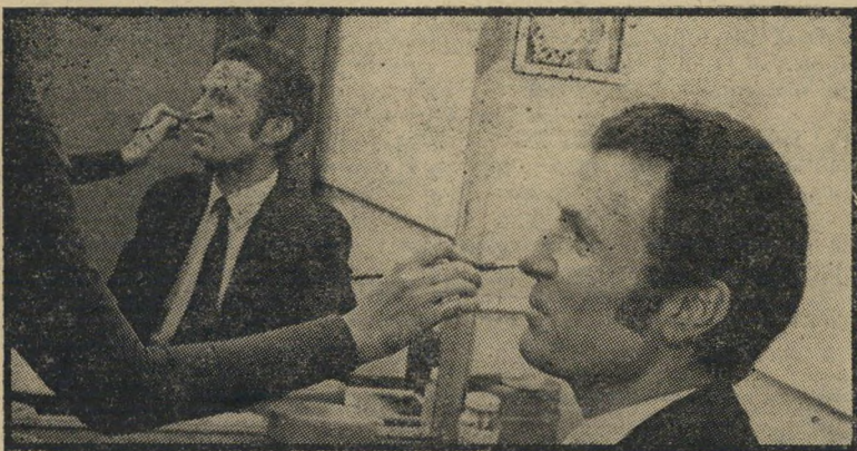
מחזים פירסט טיבון במצב

סטודנטים ערביים סביב שולחן במנזה של אוניברסיטת חיפה, כשאל שולחן סמוך מסבים שטודנטים יהודיים, שאחד מהם חובש כיפה והאחר הוא נכה צה"ל. היחסים בין הסטודנטים היהודים והערבים באוניברסיטה היו תקינים, עד שנפתח מסע-ההסתה.