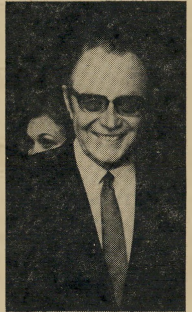
בדין בדין כתיב שווה לכל נפש

מרגע שהחל לומד לפענח את הסימנים השחורים הקטנים המרכיבים את שפתו, הופך תלמיד כיתה א' חלק במערכה הי גדולה על השפה העברית. רביסירבים הקוראים עיתונים, ספרים ושלטים, הכותבים מיכתבים ושירים ומע לים מחשבותיהם על הכתב, אף אינם מער לים בדעתם כי אותם צירופי-סימנים הי קרויים מילים, ואשר צורתם קבועה וידועה ועומדת כאילו מקדמת-דנא, בצורתה הי