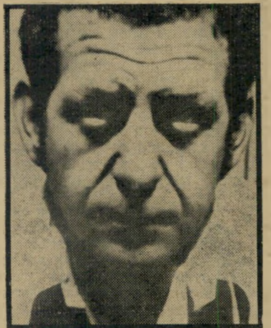
מועמדיההסגרה אושרי פירצה לגנב

הסכם הסריתוקף. חוקיההסגרה קור בע, כי הסכמההסגרה ימנע את העברת המוסגר למדינה שלישית. מן המדינה ש' אליה מסגרים את העבריינ. כן דורש חוקי ההסגרה, כי בהסכם יאמר במפורש שניתן להעמיד את המוסגר לדין רק על העביר רות שעליהן ביקשו את הסגרתו. והנה, התברר כי בהסכמההסגרה הקיים