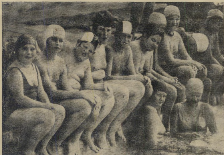
קבוצת מתגלצים שהגיעה בשקום ליס-המלח מימין: גדוד האבטחה

עיר ובית ספר למתגלצים. נביא שתיים-שלוש חטיבות ל- אבטחה מפני ערבים זידונים. ונוכל להתגלץ' ערב/ ובוקר וערב. יהיה נחמד. אתם תיראו.