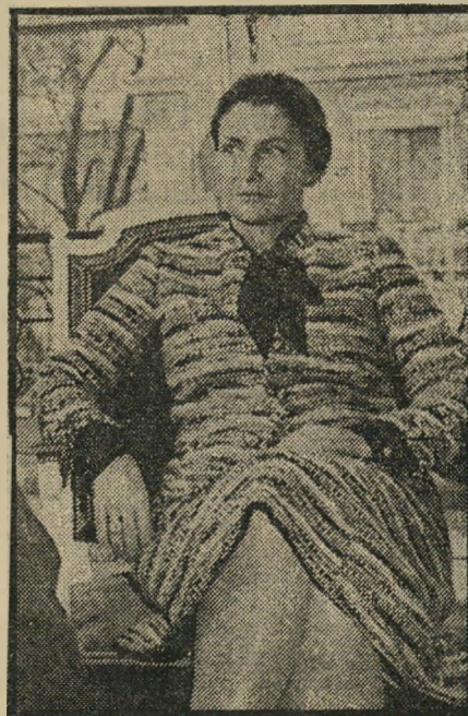
שרת-בריאות וייל מותר להפיל

הפלה ככנסת. לעומת גיזחון זה, בו לט עוד יותר פיגורה של הכנסת. בכנסת הקודמת נכשלה רפורמה זו בהצבעה חופשית, מפני שחסרו לה שני קולות.