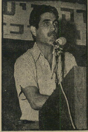
מנכ"ל חדש גרנית נתיבי כסף

בשנה האחרונה היה, למעשה, מחוסר- עבודה, והמינוי שקיבל משר-התחבורה - אביר הממלכתיות הצרופה והלוחם במינויים מפלגתיים - הצילו ממצב- ביט.