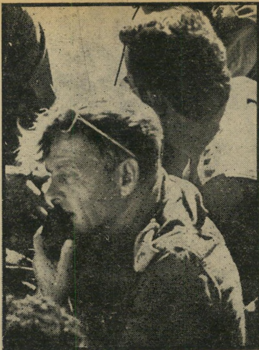
ברן מדבר באלחוט בחפ"ק

ב תום מילחמת יום הכיפורים זומנו מפקדי ה-אוגדות, שנטלו חלק במלחמה, לפגישה עם ועדת העורכים של העיתונות הישראלית. כל אלוף סיפר על מעללי אוגדתו וקרבותיה. כאשר הגיע תורו של האלוף אברהם ("ברנ") אדן לסכם את הקרבות בהם השתתפה אוגדתו, הוא לא הירבה במילים. ברן, הידוע בצה"ל כמי שאינו מצטיין דווקא בניסוחים ודברנות מופלגת, הסתפק במשפט: "אנחנו בסך הכל נלחמנו על חיינו". שנה אחרי המלחמה נאלץ האלוף אדן, אחד המעטים מבין אלופי צה"ל שהשתתפו במלחמת יום הכיפורים ושנותרו בצה"ל, להגן שוב על חייו. הפעם היתה זו מלחמה על חיו כמצביא. דווקא האלוף שהיה מעורב פחות מאחרים במלחמות הגנרלים שהטילו את צילן על מלחמת יום הכיפורים, מצא את עצמו במרכז של פרשה עכורה שאימה להטיל כחם על כל הקאריירה הצבאית שלו.