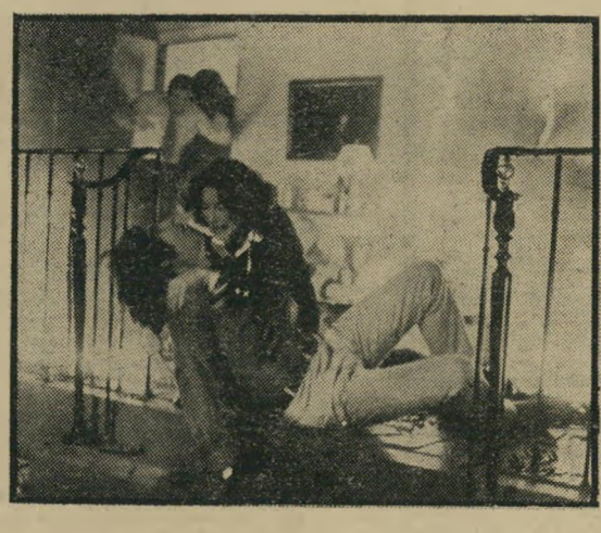
האקט וקליין: פסיכולוגיה בגרוש

על כן, עוד מתקבל על הדעת איכשהו. אלא שכאן מתחיל ד"ר פרויד לבלבל את היוצרות וכידוע פרויד הוא האויב המושבע של שיחורור האשה (איך הוא העו לתאר אותן כחפצים בלבד בתת-ההכרה הגברית, ובכלל-ל קשור את הכל למיטה כאילו נשים אינן יודעות שום דברים אחרים?), ובכך, בגלל חדוקטור המכובד, הופך הקשר בין האם לבן לתסביך אדיפוס, ואחרי שהצאצא עובר