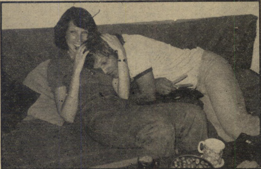
"בעיקבות המלחמה" בציורים, ששירת ביחידה קרבית, הטריפה את דעתה, והיא החליטה להישא לו. האחרונה חל מיפנה בחייה של גלה. הדאגה לחברה החדש גיל (איתה)