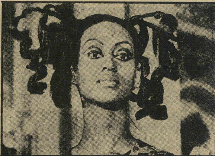
שרת-החוק כאגאנייה יחסי חוק

תקנות מסייה-הכנסת אוסרות תשלום על (המשך בעמוד 16)