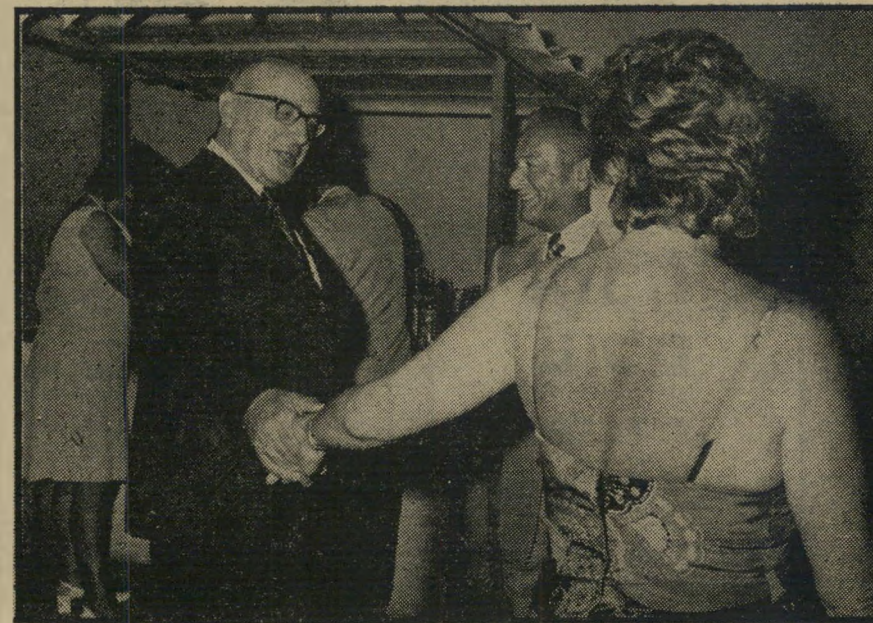
במסיבה חברתית עם מושביץ ומעמיד פני ישן בכנסת -