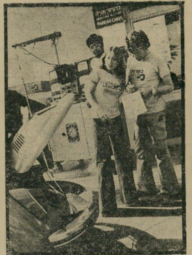
בוהני „מגור“ בפעולה. המישרד המליץ, אבל...

במיבצע חורף-ללא-בעיות של מגור, נבדקות מדיייום כ-200 מכונות. בדיקתה של כל מכונה נמשכת כ-10 דקות. החילה תכננה החברה לסיים את ה" מיבצע ב-22 בנובמבר, אך בשל ההיענות