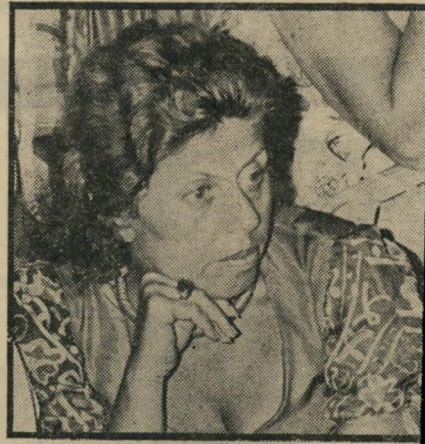
ח"כ אלזני נהג צמוד