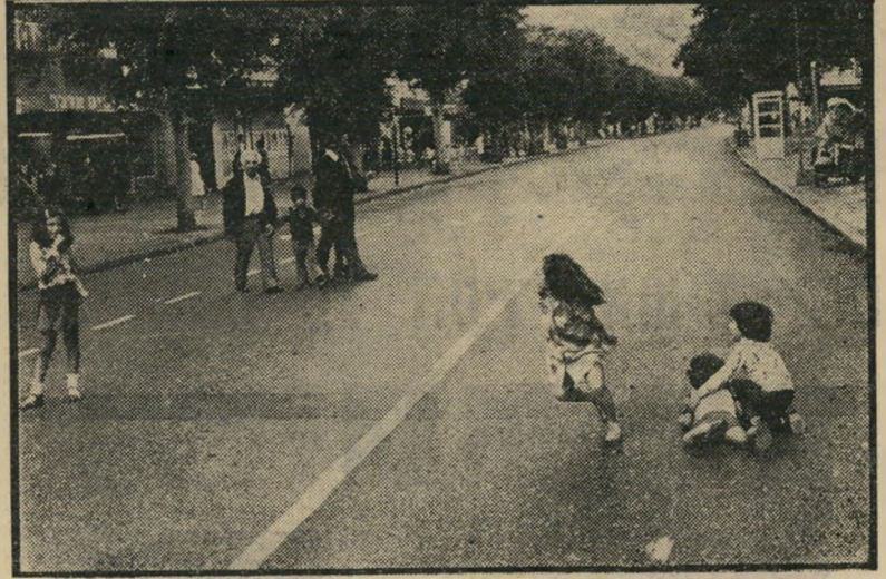
יודים משחקים עך הכביש במידרחוב כתליאביב שבת אמיתית —

"אני מסתובב לפעמים בדינגוף בשבת, בעיקר כימיהורף יפים כשאני לא הולך לים, וכימעט תמיד הפריעו לי שם חברה צעירים שבאו עם המכוניות שלהם. הם בעצם לא צריכים את הרחוב כדי לנסוע בו, חשבתי לעצמי, אלא כדי לעשות רושם, או למה שלא נהפוך את דינגוף לרחוב המיועד להולכי-רגל בלבד?" מאחר שבתוקף תפקידו כראש מחלקת-